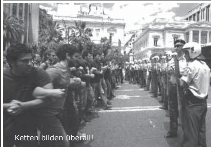
Ketten bilden überall!

ATHEN (harle/kiez) Gaia könnte auferstehen, sollte sich das Chaos an den griechischen Unis weiter steigern. Solange es abends ausreichend dionysisch abgeht und die Politiker bei schönem Wetter weiterhin spartanische Schärpen in die autonomen Räume und auf die Campi schicken, wird das Erasmus Jahr in Thessaloniki und Athen weiterhin als Geheimtipp für AutonomInnen gehandelt werden. Denn in Griechenland, da ist die Pitalos! Da fallen Oliven aus den Wolken und Mollis in die Wachen. Ein Auslands BAFöGs-Einschnitt für BewerberInnen in Richtung Hellas wurde vom Amt für Ausbildungsförderung Tübingen mit Angst begründet. Angst davor, es könnten von den üppigen Summen Griechen gekauft werden, die dann unsere Bullen vermöbeln und Arbeitsplätze klauen. Nicht schlecht gedacht, sagt die Redaktion, ist die Wahrscheinlichkeit doch hoch, dass Baden-Württembergische StudentInnen eher zu Menschenhändlern als zu Widerständischen werden.