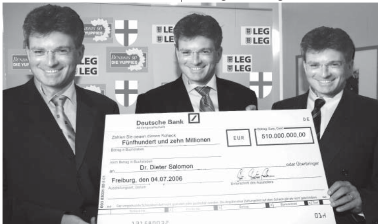
Der rechte ist OB von Freiburg, der linke ist Aufsichtsrat der LEG, aber wer ist der in der Mitte?