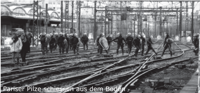
Pariser Pilze schießen aus dem Boden

So spazierte am besagten Tag ein munterer Haufen bewegter Arbeiter und fröhlicher Kurden, neuer Punks und alter Hippies, Bummelstudenten und kleiner schwarzer Figuren mit dunklen Brillen durchs schöne Connewitz. Über ihnen: Die Leipziger Sonne. Vor ihnen, am Hauptbahnhof: Huppka und seine 220 Faschisten.