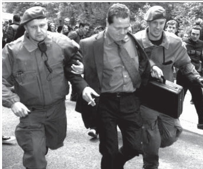
Kernforschungszentrum Jülich 24.Mai 2006: Kölner Sennatoren auf dem Weg zur Demokratie