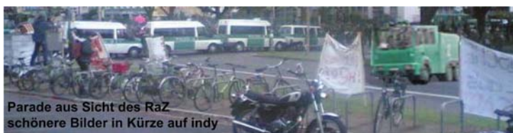
Parade aus Sicht des RaZ schönere Bilder in Kürze auf indy