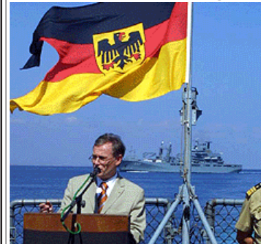
H. Köhler bei seiner legendären Forderung nach einer "Vorfahrt für Rüstung" auf dem Zerstörer "Bergen-Franken"

FREIBURG (deep press). Auch der Bundespräsident ist nun bestens über die Forderungen der BesetzerInnen informiert. Eine vom RaZ organisierte Begrüßungsexkursion während seines Besuches in Freiburg vor drei Tagen erreichte es sogar mit Seiner Hoheit Horst ins Gespräch zu kommen und ihm ein paar christlich-demokratisch gefärbte Floskeln zu entlocken. Zuvor war es jedoch nötig, ihn rufend und singend durch die halbe Stadt zu verfolgen. Als er sich aus gesundheitlichen Gründen nicht aus der Glasgalerie des Konzerthauses hinablassen wollte, formierten die Protestexkursionisten ein großes H aus Menschen, was für alles mögliche hätte stehen können... Als ihm zu guter letzt die Forderungen der BesetzerInnen übergeben wurden und er über den Mißstand nichtverfasster Studierendenschaft in Bayern und Baden-Württemberg zum allerersten Mal informiert wurde, kehrte die Exkursion ins autonome Rektorat zurück. Hier gab es das übliche Kulturprogramm mit Konzerten und Theater (diesmal mit der "Freistil" Improtheatergruppe), was die Aktivisten entspannen konnte und aufs Neue die Wichtigkeit der Fortführung des Kulturkonzeptes des RaZ unterstrich.